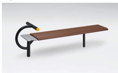
腹筋ベンチ(レックウッド/チャコール)