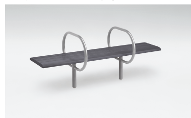
あんばベンチ(アーバンウッド/グレー)