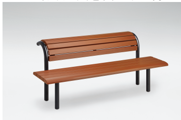
背のばしベンチ(レックウッド/レッド)