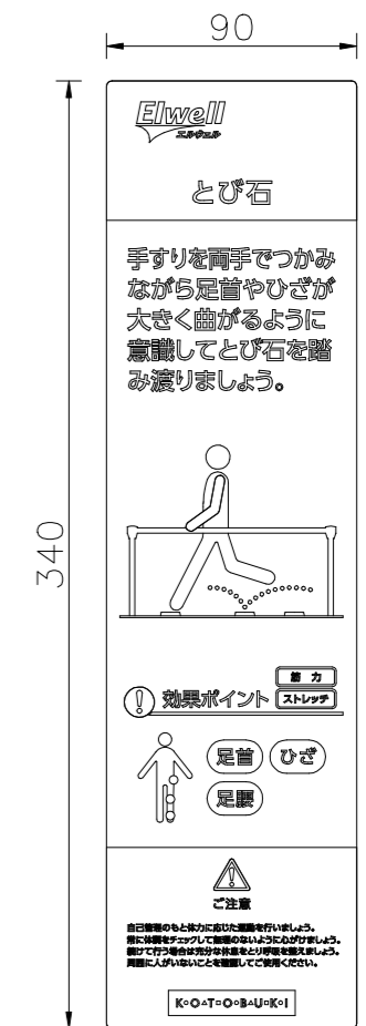
サイン表示内容詳細図 S=1/3